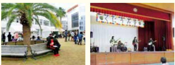
くにうみ祭でにぎわうキャンパス ステージでのイベント

11月19日、3年ぶりのくにうみ祭を開催しました。新型コロナウイルスの影響もあり、多くの学生がくにうみ祭を経験したことがない中、2年生が中心となって、今年度のくにうみ祭を一から作り上げ、盛り上げてくれました。当日は多くの人にイベント、展示、模擬店を楽しんでいただけたと感じています。ステージでは、淡路三原高校吹奏楽部、和太鼓志童、あわじ護身術クラブの皆さまがご尽力くださいました。本学のイベントを引き続き市民の皆さまに楽しんでいただけるよう次年度以降も精進しますので、よろしくお願いいたします。