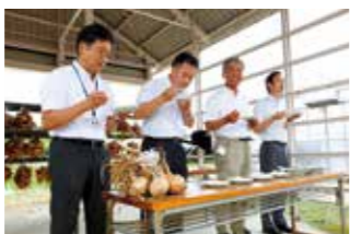
宇宙を旅した種から育ったタマネギを試食する関係者ら