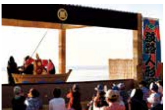
慶野松原で行われた「野掛け芝居公演」