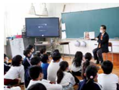
絵本の読み聞かせを行う守本市長

11月30日の「絵本の日」にあわせて、「おもしろポイント制度」の活動者とともに、北阿万小学校で、市長・副市長・教育長が絵本の読み聞かせを行いました。 おもしろポイント制度では、小学校での活動の一つとして、児童への絵本の読み聞かせがあります。子どもたちの読書習慣の定着とともに、活動への参加を促そうと市3役による読み聞かせを企画しました。 3人は各学年の教室を訪