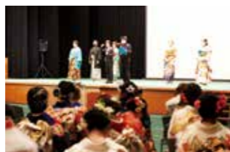
1年越しに開催された2021年成人式