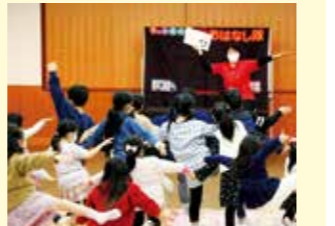
絵本の読み聞かせで体を動かして楽しむ子どもたち