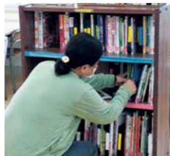
図書室の本の整理

有償ボランティア 「おもしろポイント制度」 個別相談会 「おもしろポイント制度」で、あなたの力と経験を社会の中で生かしませんか。週1回など自分の好きなペースで活動できます。相談会にお気軽にお立ち寄りください。