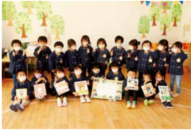
寄贈された絵本と、お礼の気持ちを込めた感謝状を手にする賀集保育所の園児ら