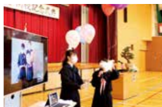
倭文中学校の閉校式で風船を飛ばす卒業生