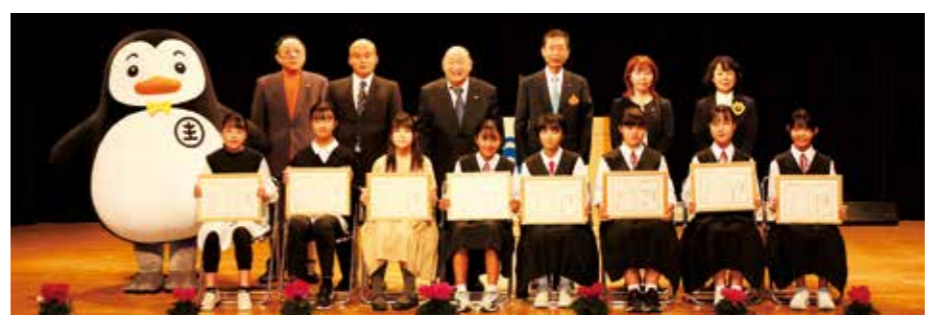
同作文コンテストで入賞した小中学生