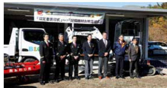
防災備蓄倉庫で行われた協定書調印式

南海トラフ巨大地震など の災害に備えようと、南あ わじ市はB&G財団(東京 都)と相互支援協定を締結 しました。 同財団は全国54市町村で 防災拠点整備の支援や、自 治体間の相互連携促進に取 り組んでいます。 市は同財団から防災拠点 整備費として、昨年度から 来年度までの3年間で、最 大3900万円の支援を受 けます。助成金を活用し、 文化体育館(北阿万)には 新たに防災備蓄倉庫を設置 しました。また、油圧ショ ベルやスライドダンプ、救