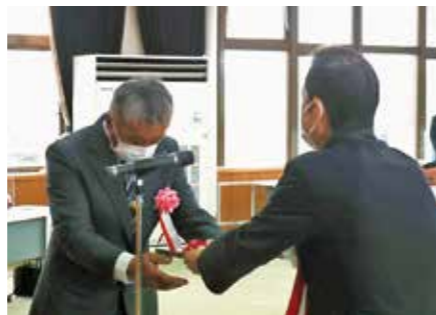
守本市長から表彰状を受け取る受賞者(左)