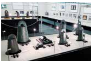
全7点が玉青館で展示されている松帆銅鐸