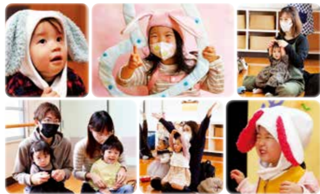
11月24日(木) おひざのうえのおはなし会×干支フォト