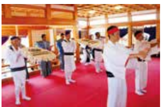
阿万上町に伝わる「阿万の風流大踊小踊」