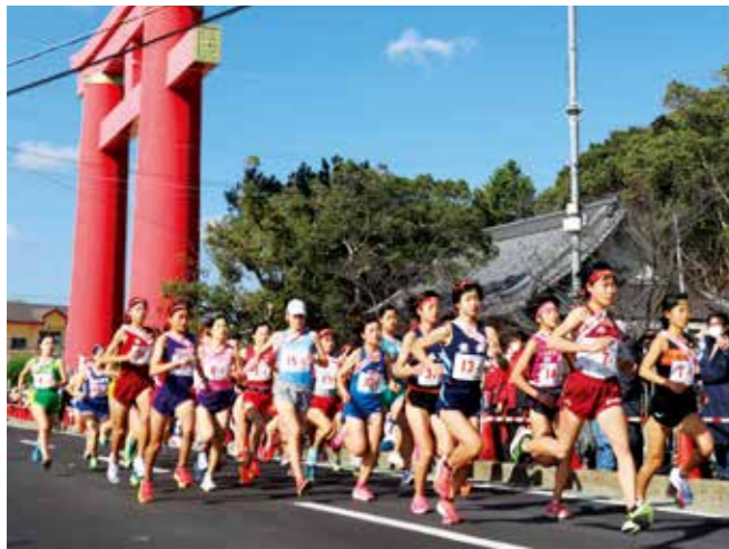
おのころ島神社前をスタートする選手ら