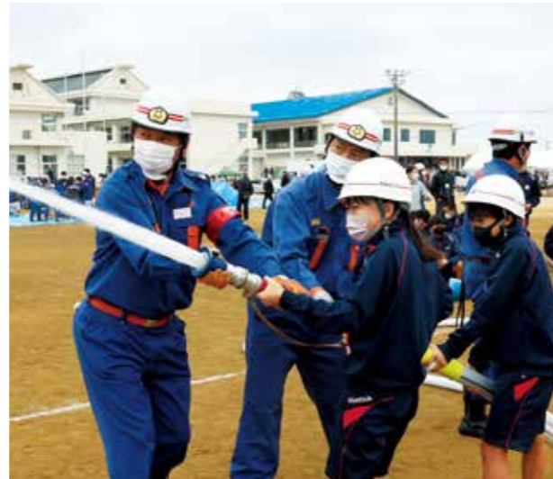
消防団の指導を受けながら放水訓練を行う生徒

メイン会場となった西淡中学校での訓練には、同校の生徒や住民、関係者ら約640人が参加しました。体育館で実施した避難所運営訓練では、生徒らが受付を担当。検温や名簿作成、避難スペースへの誘導などを行いました。グラウンドでは、生徒らが消防団の指導のもと放水訓練や負傷者の搬送訓練を行ったほか、淡路広域消防事務組合や県警機動隊による救出訓練などがありました。