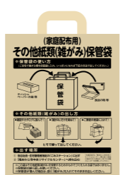
その他紙類（雑がみ）保管袋

地球温暖化防止の一環として、ごみ焼却による温室効果ガスを削減するために、「その他紙類（雑がみ）」を回収・リサイクルする取り組みを強化します。 家庭ごみの約4割は紙類です。リサイクル可能な紙類を分別することで、燃えるごみの量が減り、市指定ごみ袋の節約にもなります。 「その他紙類（雑がみ）保管袋」は、ごみカレンダーと一緒に配布しますので、ごみの減量化にご協力をお願いします。