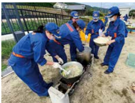
かまどベンチを使用して炊き出し訓練を行う団員ら

南あわじ市消防団なでしこ分団の団員らが10月31日、賀集八幡防災公園で炊き出し訓練を行いました。