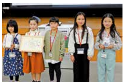
南あわじ市長賞を受賞した元気いっぱいあまっ子のメンバー