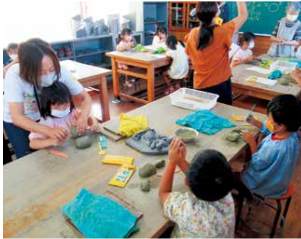
瓦粘土をこねて鬼瓦のパーツを作る園児ら