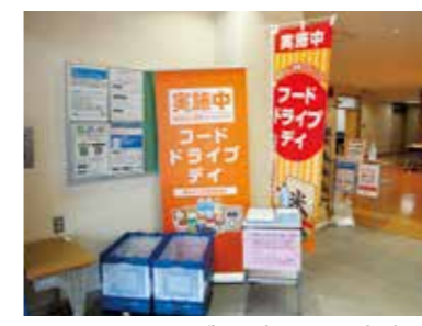
フードドライブ・デイには市内4カ所の公民館に食品受付箱を設置

「フードドライブ」は、ご家庭などで眠っている食品・食材を持ち寄り、生活に不安を感じている人や福祉施設などに寄付をする活動のことです。誰でも気軽に食品・食材を持ち込みできるように、毎月末の平日3日間を「フードドライブ・デイ」と銘打ち、南あわじ市消費者協会が市内4カ所の公民館に食品受付箱を設置しています。 「買わずに捨ててしまえばいい」「たたくさんもらって余ってる」など、ご家庭などで眠っている食品・食材があれば、ぜひお持ちください。 日時 毎月末の平日3日間の午前9時～午後4時 12月～翌年3月の実施日 ◆12月24日(金)、27日(月)、28日(火) ◆1月27日(木)、28日(金)、31日(月) ◆2月24日(木)、25日(金)、28日(月) ◆3月29日(火)、30日(水)、31日(木)