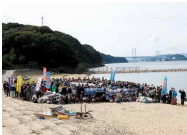
伊弉海岸では550人が清掃活動に参加。ごみが拾い集められ美しい砂浜になりました

渦潮発生のメカニズムに大きく関わる鳴門、紀淡、明石の3海峡周辺の美化活動を通じて、世界遺産登録への機運を高めようという取り組み。伊弉海岸では約550人が砂浜に流れ着いた木やプラスチックなどを拾い集め、約860kgのごみが回収されました。また、藻塩づくり体験などのワークショップも行われました。