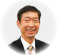
南あわじ市長 守本 憲弘