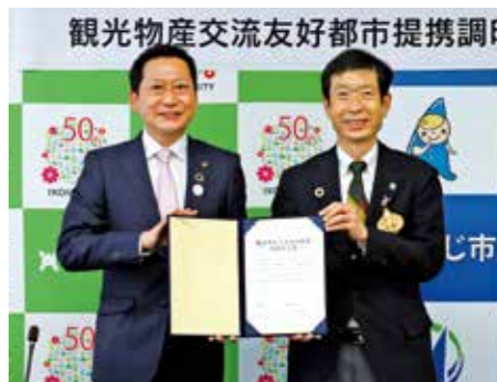
小紫生駒市長(左)と守本市長

南あわじ市と奈良県生駒市は10月29日、観光物産交流友好都市提携を締結しました。