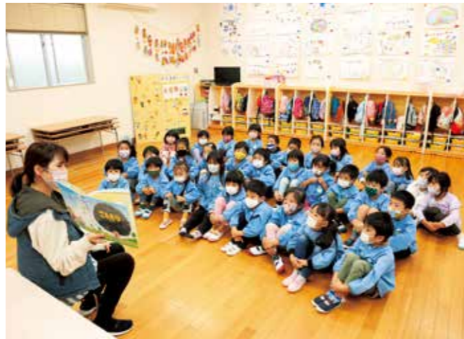
寄贈された絵本の読み聞かせを楽しむ榎列保育所の園児ら

寄贈された絵本は、園児らが自分で読んだり、読み聞かせで活用されたりしています。また、保育所では園児らが親子で楽しい時間が過ごせるように、絵本の貸し出しを行っています。榎列保育所の園児らは「家族とみんなで読んだ」「読んでもらってうれしい」と喜んでいました。