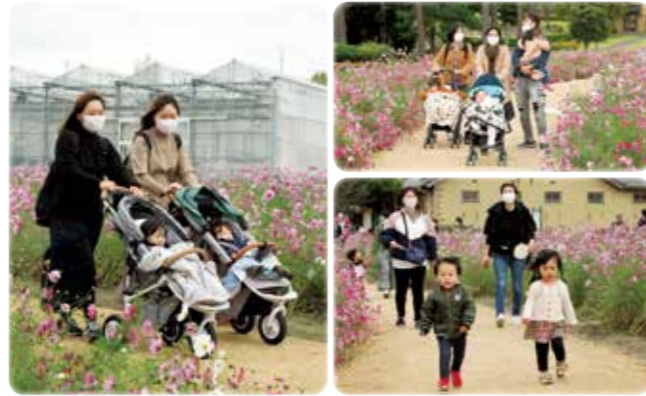
11月9日(火) 秋のおさんぽ

※11月17日現在の行事予定を掲載しています。 定員に達している場合はご了承ください