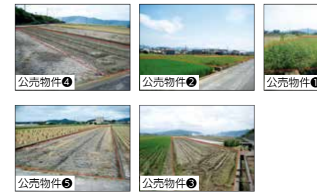
公売物件① 公売物件② 公売物件③ 公売物件④ 公売物件⑤

滞納処分を行った不動産を公売します。詳しくは市役所掲示板の公売公告兼見積価格公告をご覧ください。 物件① ▽所在地 榎列松田259番 (田、1188.0㎡) ▽見積価格 (最低公売価額) 52万円 ▽公売保証金 6万円 物件② ▽所在地 榎列松田262番 (田、609.0㎡) ▽見積価格 (最低公売価額) 27万円 ▽公売保証金 3万円 物件③ ▽所在地 榎列松田甲38番 (田、612.0㎡) ▽見積価格 (最低公売価額) 26万円 ▽公売保証金 3万円 物件④ ▽所在地 榎列松田甲61番 (田、187.0㎡) ▽見積価格 (最低公売価額) 7万円 ▽公売保証金 1万円 物件⑤ ▽所在地 榎列松田甲95番 (田、527.0㎡) ▽見積価格 (最低公売価額) 22万円 ▽公売保証金 3万円