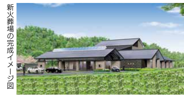
新火葬場の完成イメージ図

8月3日、桜花の郷新火葬場建設工事の安全祈願祭があり、地区役員や市、工事関係者ら約30人が出席しました。供用開始は令和5年の予定で、老朽化が進む現施設(賀集)に代わり、人生の終焉の場となります。 新火葬場は、ユニバーサルデザインを採用し、周辺環境に配慮した最新式の火葬炉設備を設置するなど、施設としての機能を大幅に充実させます。