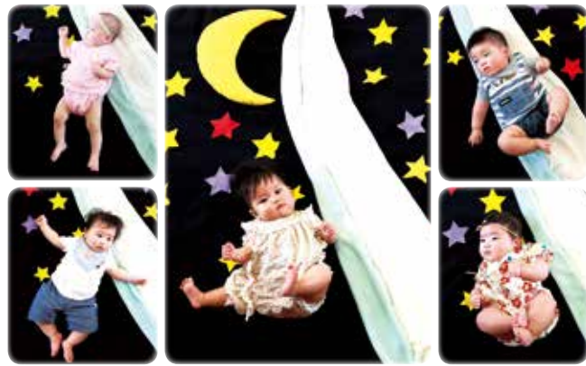
7月5日(月)おひるねアート