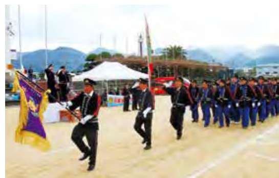
分列行進を披露する消防団員

初出式は、南あわじ市の消防力を披露し、住民らに消防活動への理解や信頼を深めてもらうために毎年実施されています。式典では、消防車両38台による機動隊入場につき、なでしこ分団と第1方面隊から第4方面隊までの団員らによる分列行進が行われました。