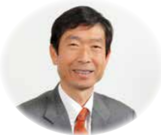
南あわじ市長 守本 憲弘