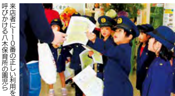
来店者に110番の正しい利用を呼びかける八木保育所の園児ら

また、110番は最寄りの警察署ではなく、兵庫県警察本部(神戸市)の通信指令室につながります。通報する場合は、居場所を市や郡の名前からお伝えいただき、対応する警察官からの質問に落ち着いてはつきりとお答えください。