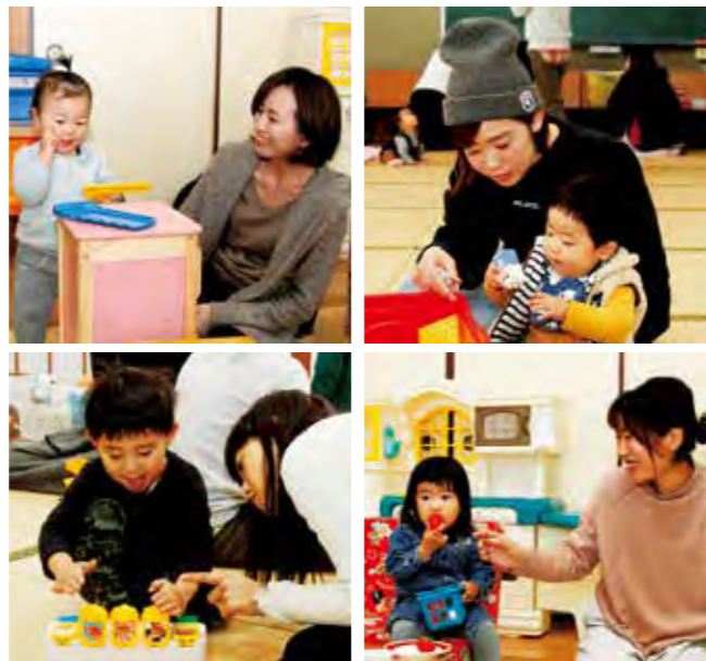
1月14日(木)せいだん出前ひろば

● ふれあいプレイルーム (平日9:00～16:00) (申込不要、ゆめるんノート、名札持参)