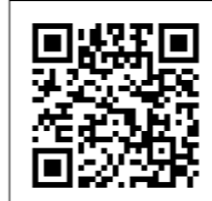
確定申告書等 作成コーナー 二次元コード

国税庁ホームページ(https://www.nta.go.jp)の「確定申告書等作成コーナー」で、所得税や収支内訳書などを作成することができます。 作成方法は2通りあり、①パソコン上で作成した申告書をプリントし、郵送等で税務署に提出する方法と、②パソコンやスマホで作成した申