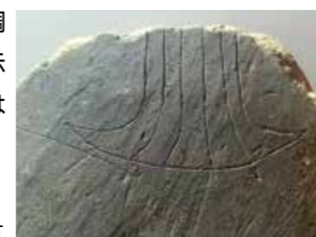
(写真) 出土した絵画土器片

八木入田に位置する入田稻荷前遺跡では、平成30年度の調査で弥生時代後期～終末期の竪穴建物から絵画土器片が出土しました。河内地方から搬入された壺の肩部にバチ形文や直線文、弧帯文といった絵画が描かれていました。このような遺物は拠点的な集落から出土する傾向にあり、入田稻荷前遺跡もその一つと考えられます。現在、南あわじ市発掘調査速報展で展示中です(詳しくは18頁に掲載)。