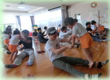
親子あそび（幼稚園）