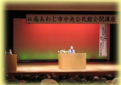
中央公民館公開講座