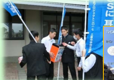
いじめ防止プロジェクト（中学校）