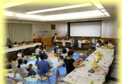
図書館フェア 絵本づくり