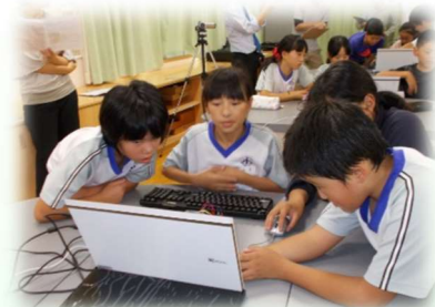
プログラミング教育（小学校）