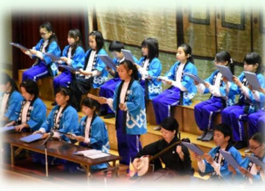
伝統芸能継承（小学校）