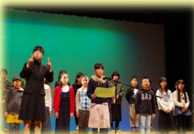
人権フェスティバル