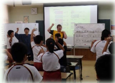
外国語活動（小学校）