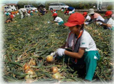
環境体験学習（小学校）