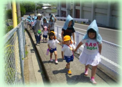
保小交流（保育所・小学校）