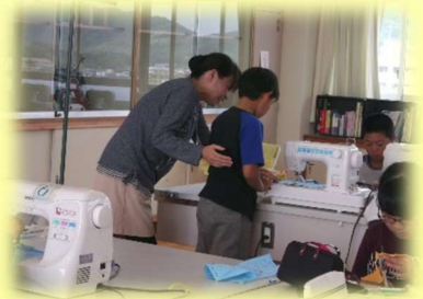
学校支援地域ボランティア