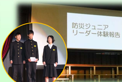
防災ジュニアリーダー（中学校）