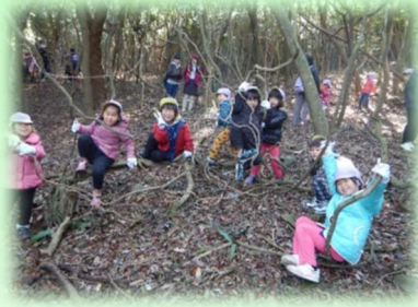
自然と親しむ（こども園）