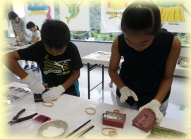
松帆銅鐸鑄造体験