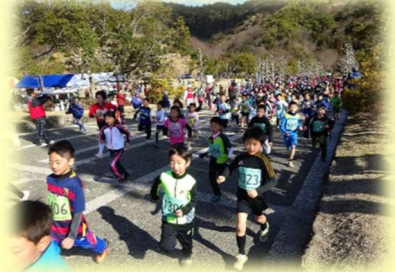
ランニングフェスティバル