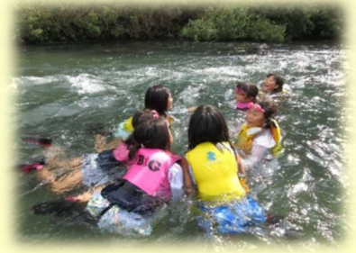
わんぱく塾 四万十川源流体験