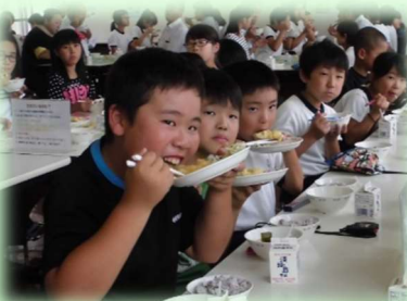
学校給食地場食材活用 （幼稚園・小学校・中学校）