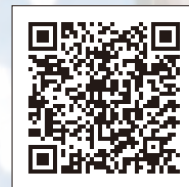
灘黒岩水仙郷FB 二次元コード