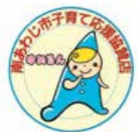
応援協賛店ステッカー

子育て応援優待カード事業 満18歳未満のお子様を1人以上養育しているご家庭に「ゆめるんカード」を発行しています。市内協賛店に「ゆめるんカード」を提示すると、様々な特典を受けることができます。協賛店ステッカーが目印です。 カードの交付・再発行については、お問い合わせください。 ▽特典例 ポイント加算、景品プレゼントなど ▽協賛店 55店舗(6月18日現在) ※協賛店一覧は市ホームページをご覧ください