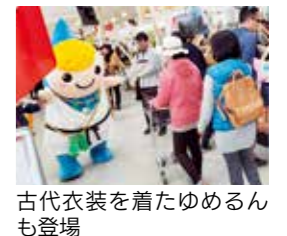
古代衣装を着たゆめらんも登場

マルシェ・ワークショップ ▽場所 美菜恋来屋 ▽内容 青銅器のミニチュアづくり、勾玉づくり、古代の組みもづくり、古代ガチャガチャ、古代布しぼり、古代米おはぎ、どうたく風呂敷、火おこし体験、弥生人コスチューム、その他帆船銅鑼グッズなど タイアップ企画 ①美菜恋100%スムージー 淡路島の野菜と果物のみを使ったゴールドプレスジュース ②南淡そうめん食堂 淡路島の特産品と古代米を使った創作素麺 ③イングランドの丘で古代の宝さがし イングランドの丘園内に隠された宝箱を探そう! ※①②の場所は美菜恋来屋