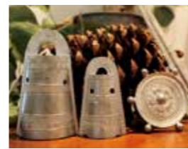
青銅器のミニチュア

楽しい古代体験ワークショップと、帆船銅鑼や古代がテーマの商品販売を行います。大人も子どもも楽しめる内容です。ので、ご来場をお待ちしています。 ※イベントの詳細は、「二次元コードから」帆船銅鑼特設サイトをご覧ください。 本格製造体験の参加者募集 淡路島古代フェスティバルで、自分で絵を描いて、オリジナルの昔のお金を作るワークショップを行いますのでぜひご参加ください。 また、本物の青銅を炉で溶かして、銅鑼を作るデモンストラーションも行います。 ▽日時 3月10日(日) 午後1時～2時30分 ▽場所 美菜恋来屋 ▽募集定員 10人(先着順) ※小学6年生以下は保護者要同伴 ▽参加費 500円(材料費等) ▽申込方法 当日受付