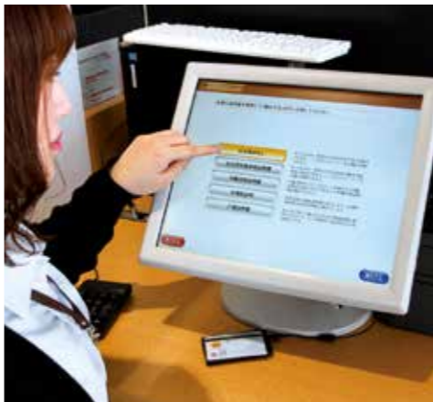
庁舎1階ロビーに設置した「タッチパネル端末機」。マイナンバーカードを利用して、スムーズに住民票等の交付申請ができます。

マイナンバーカードを利用して、住民票等の交付申請ができる「タッチパネル端末機」を市役所1階ロビーに設置しました。 タッチパネルで申請していただいた後、番号をお呼びします。そこで手数料と引き換えに証明書を受け取っていただきます。 本人確認や申請書の記入、印鑑登録証の提示は必要がないため、スムーズな手続きができます。また、手数料や画面操作は、コンビニ交付サービスと同じです。 取得できる証明書 住民票、住民票記載事項証明書、印鑑登録証明書、戸籍謄抄本、課税証明書 利用できる人 南あわじ市に住民登録があり、利用者用電子証明書が搭載されたマイナンバーカードをお持ちの人(利用者本人に限ります) ※戸籍謄抄本は住所および本籍地の両方が南あわじ市にある人に限ります 必要なもの マイナンバーカード(数字4桁の暗証番号が必要) 利用時間 窓口開庁時間(土日祝日はを除く) ※戸籍謄抄本は午前9時～午後5時