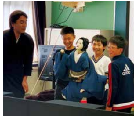
3人遣いの人形を体験をする福良小学校児童