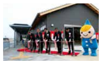
陸の港西淡にサイクルステーションを新設