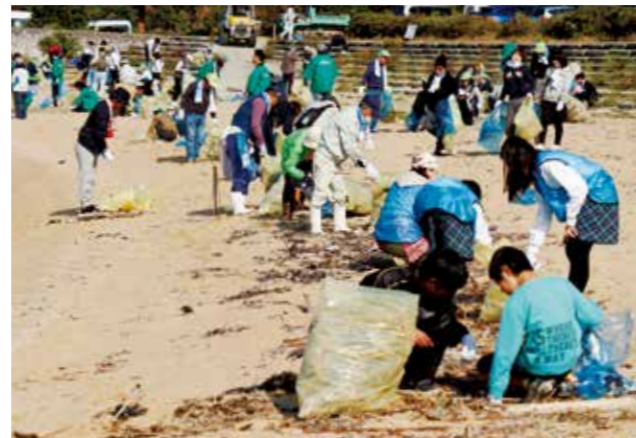
海岸に流れ着いたごみを拾う参加者ら

また、清掃終了後には、子どもを対象に海水を煮詰める古代の塩づくり体験なども行われました。