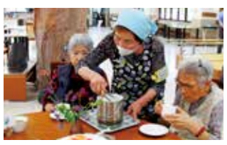
シニア世代の能力や経験を生かす高齢者等元気活躍推進事業