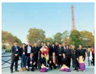
淡路人形座がバリ公演で淡路人形浄瑠璃の魅力を世界へ発信