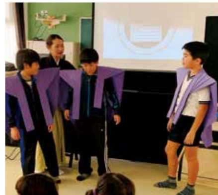
太夫の衣装を着る福良小学校児童