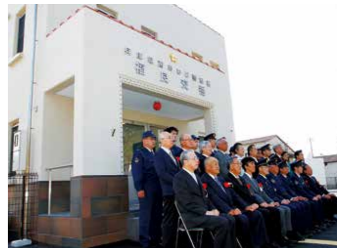
福良交番の前で完成を祝う関係者ら

南あわじ警察署の「福良交番」がこのたび竣工し、11月13日から業務を開始。11月21日に開所式が行われました。