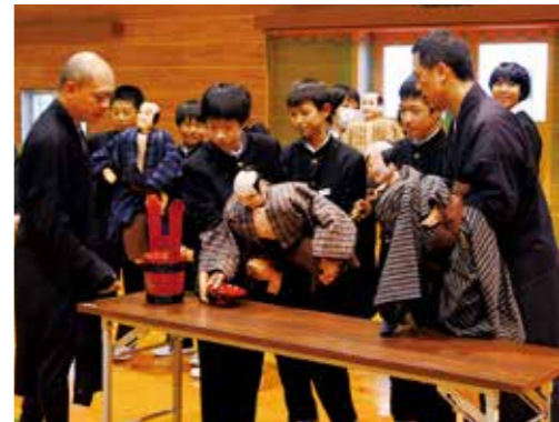
戎舞体験で、村人の人形遣いを練習する三原中学校生徒