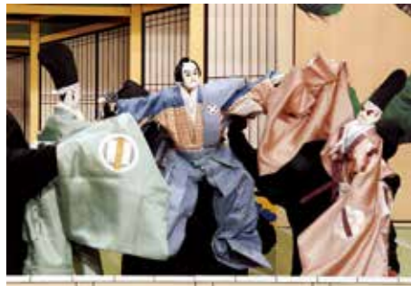
淡路人形座は公演だけでなく、淡路人形浄瑠璃の発展・普及活動に取り組んでいます

そんな時、淡路島の伝統芸能を守ろうとする人々の力で 1964 年「淡路人形座」が立ち上げられました。 以来、淡路人形座は、島内で唯一プロとして活動する人形