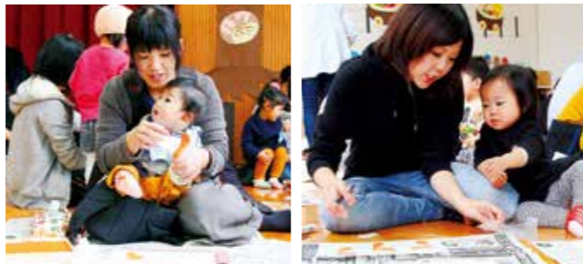
11月28日(水)手形アート「だるまさんが」