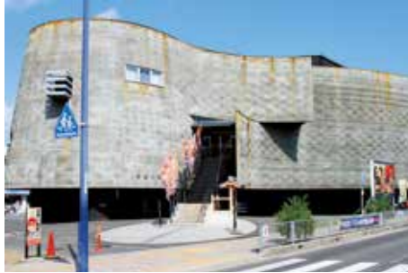
平成 24 年に淡路人形座の新館が福良に完成。道の駅福良と、みなとオアシス福良の構成施設として観光名所にもなっています