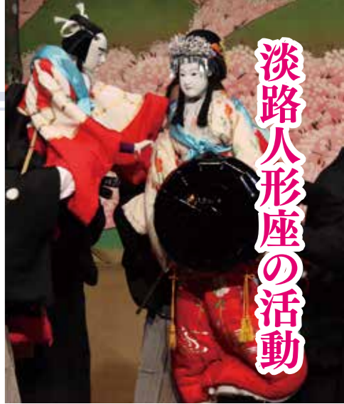
淡路人形座の活動