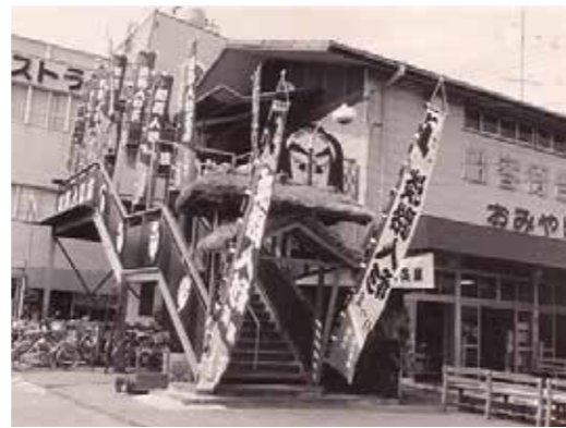
阿淡汽船 2 階にあった淡路人形座 (昭和 51 年)

全国各地でもはやされた淡路人形芝居でしたが、明治になると、大きな時代の変化の中で観客の関心が他の娯楽に移ったり、人形芝居の修行の辛さから若い後継者が育たなかつたりで、古くからの人形座は次々に姿を消し、淡路人形芝居は消滅の危機にさらされました。