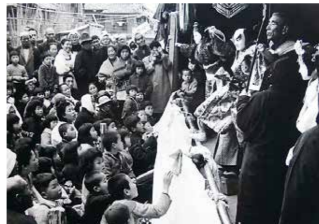
昭和 30 年頃の野掛け芝居の様子