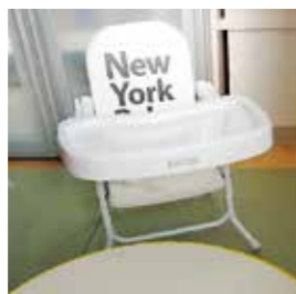
寄付金で購入したローチェア(ゆめんセンター)