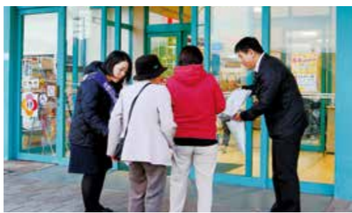
来店客に啓発用のチラシ等を手渡す市と警察職員

11月12日から25日までの「女性に対する暴力をなくす運動」期間に合わせて、11月21日に三原ショッピングプラザパルティで、市と南あわじ警察が女性に対する暴力、セクハラ等を根絶するためのキャンペーン活動を行い、啓発チラシを配布しました。