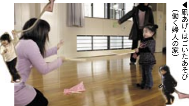
▲ 風あげはこいたあそび (働く婦人の家)