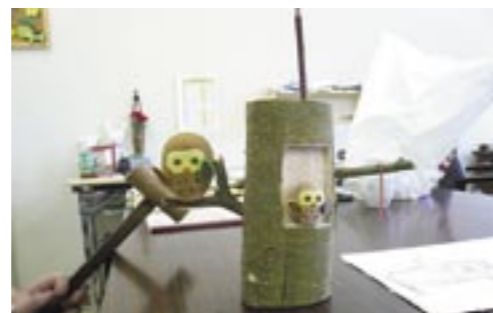
▲ 適応教室で作られた手芸作品ふくろうのくる木

自分自身や対人関係に自信を回復し、自立する力を養うことで学校へ復帰できるよう支援します。