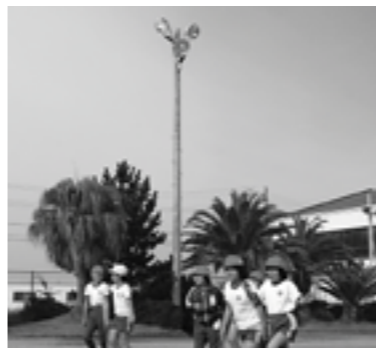
▲湊小学校に寄贈された夜間照明2基のうちの1基