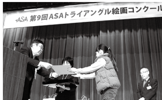
▲表彰式が11月3日、イングランドの丘で催されました