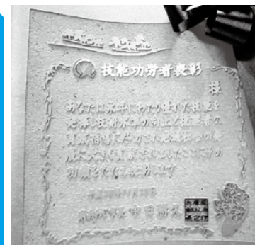
▲技能功労者に贈られた表彰状

永年優れた技能で、地域社会の発展に貢献した人の功績を讃える「南あわじ市技能功労者表彰式」が11月23日の勤労感謝の日(市役所多目的ホール)で行われ、次の13人に中田勝久市長から表彰状とともに、お祝いの言葉が贈られました。また同日、市商工会が主催する南あわじ市優良従業員表彰式も催され、40人が表彰されました。