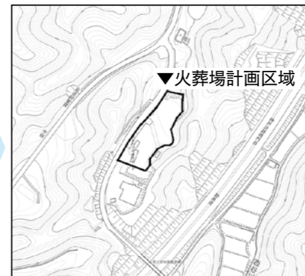
▲位置図 火葬場計画区域