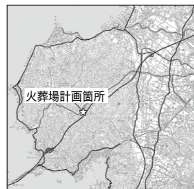
▲位置図 火葬場計画箇所

閲覧期間 10月3日～17日 閲覧場所 都市計画課(平日の開庁時間のみ) ※都市計画(素案)は市のホームページでも掲載しています。