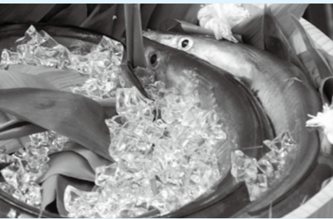
▲南あわじ市が誇る夏の味覚「鱧」

討会もいたします。 ▽日時 7月21日(木) 午後1時～5時 ▽場所 吉備国際大学 南あわじ志知キャンパス大講義室 ▽参加料 無料 ▽吉備国際大学地域連携センター ☎42・4708 平成28年度吉備国際大学地域創成生涯学習講座 7月下旬より順次開講予定！ ※詳しくは「吉備国際大学地(知)の拠点整備事業」ホームページ http://coc.kiui.ac.jp/