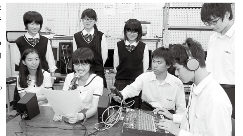
▲「投票所へ行こう!」と選挙啓発の音声CMを作成した淡路三原高校放送部