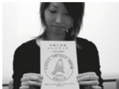
▲今年度版の「子育て支援ハンドブック」

昨年発行し、子育て世帯に好評だった「子育て支援ハンドブック」を2008年度版として再発行しました。この冊子は、市や県の子育て支援の情報をまとめたもので、妊娠や出産、子育てのライフステージにあわせて、支援が受けられる情報を掲載。A5版全32頁。総合窓口センターで無料配布しているほか、市のホームページからもご覧いただけます。