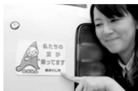
▲車に貼り付けた「赤ちゃんお出かけステッカー」

今年度から、新生児を持つ保護者の方へ、市の子育て応援キャラクター「ゆめるん」のデザインが入った交通安全啓発ステッカーを配布しています。ステッカーは、マグネット式で取り外しも簡単。「私たちの宝が乗ります」のメッセージが記載され、他のドライバーに安全運転を呼びかけます。出生届を出すときに各総合窓口センターで手渡されます。