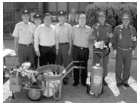
▲淡路広域消防から管理委託設置された資機材

淡路広域消防事務組合は、7月26日、沼島地区消防団に消防資機材として、小型動力ポンプセットと大型消火器、AED、AED訓練用人形の4点を管理委託しました。沼島は灘海岸の南約4kmの海上にあるため、淡路広域消防からの救援に時間を要します。また日中は、島のほとんどの男性が漁業で出漁するため、高齢者や女性、子どもが