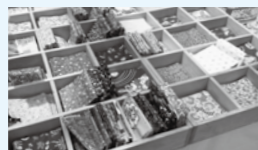
▲写真は製品の一部です