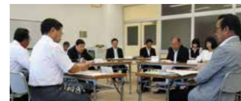
▲第1回南あわじ市総合教育会議

地方教育行政の組織及び運営に関する法律の改正により、すべての地方公共団体に「総合教育会議」の設置が義務付けられました。南あわじ市では6月1日に「第1回総合教育会議」を開催しました。同会議は市長と教育委員会では、会議設置要綱について及び教育大綱の策定についてを協議しました。