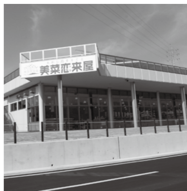
▲あわじ島まるごと食の拠点施設直売所