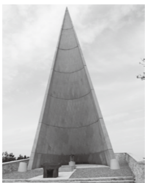
▲若人の広場公園管理事業