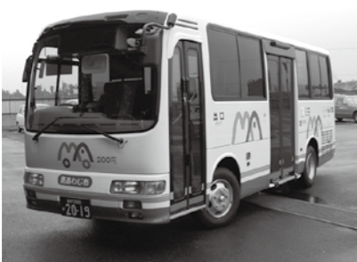
▲市内循環バス・デマンド型乗合タクシーの運行