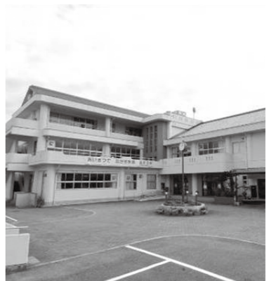
▲広田中学校舎大規模改修