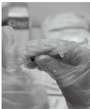
▲各種予防接種の実施