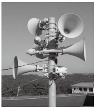
▲デジタル防災行政無線整備