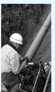
▲下水道管布設工事

▽下水道の供用開始後1年以内、公共ますにつきなぎ込みをした人は、3万2400円 ▽1年を超え2年以内の場合