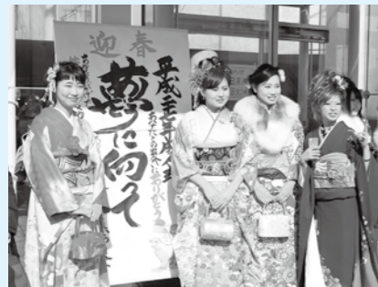
▲成人式に参加した新成人たち

平成7年1月17日、淡路島にも甚大な被害をもたらした阪神・淡路大震災。その発生から20年が経過しました。この間、被災した街並みは復興を遂げてまいりましたが、被災者の心には今なお大きな傷跡を残しています。一方で阪神・淡路大震災を知らない世代も年々増えております。震災の体験をそういった世代に伝えていくことも、私たちの大きな役割であります。また、避難路整備や防潮堤の整備など、下の面の整備も重要であることは言うまでもありません。震