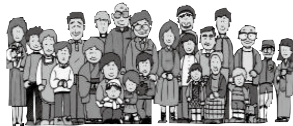
〈地域の仕組みのイメージ図〉

そのための新しい地域の仕組みとして、「地域づくり協議会」がその役割を担う組織となることを期待しています。