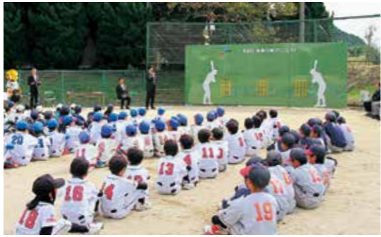
▲寄贈のベース・ウォール(高さ2.7m、幅7.2m)

阿万スポーツセンターのグラウンドに、日本野球機構(NPB)と阪神タイガースから、ベース・ウォール(ボールを壁に当てて遊ぶ設備)が寄贈され、11月3日に贈呈式が開かれました。プロ野球発足80周年記念事業「未来の侍プロジェクト」の一環として全国で12カ所しか設置されていないものです。 寄贈のベース・ウォールは、緑色の壁にバッターとストライクゾーンが描かれていて、ボールを投げて練習ができるものです。