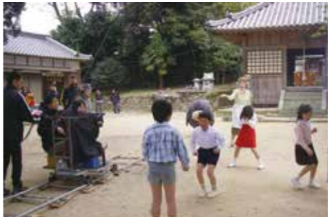
▲久度神社で行われたテレビCM撮影の様子