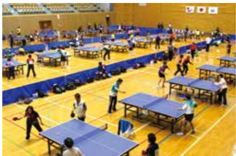
▲多くの愛好者らが集まりました

普通の卓球の球より少し大きな球を使うラージボール卓球。日本卓球協会登録選手が出場する同卓球大会は、全国の温泉地で開催されます。今年の近畿シリーズは10月29、30日の2日間、文化体育館で開催されました。