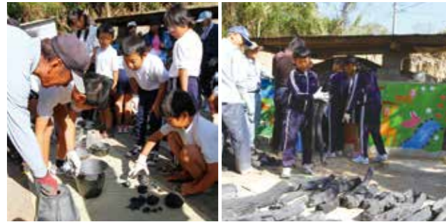
▲作品を取り出す子どもたち(左)、窯から炭を運び出す子どもたち(右)

に乾燥させた鈴や箸置きなどの作品を一緒に入れました。 老人クラブの人たちは9日の昼に火をつけ、煙の色を見ながら窯の中の温度を判断し、11日未明に止めました。17日には再び児童らも参加して出来上がった炭の運び出しを手伝いました。 子どもたちは「炭焼きは時間がかかる大変な作業と知った。良い思い出になった」と感想を話していました。