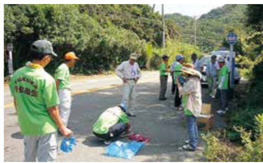
▲清掃活動を行う福良保健衛生推進協議会のメンバー

一環として清掃活動を行いました。 同協議会のメンバー19人は3組にわかれて、なないろ館前から岬公園まで道路の空き缶やビン、その他ゴミなどを拾いました。また同時に参加者の事故を防ぐため、道路の安全点検等を約3時間かけて実施しました。