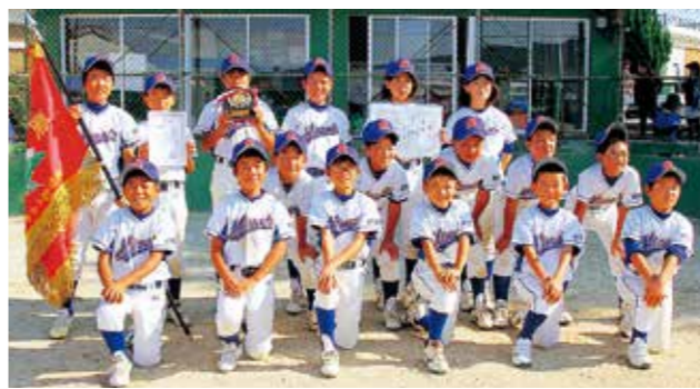
▲優勝の湊少年野球クラブ

決勝戦は2年連続優勝をめざす湊少年野球クラブと春秋連覇をねらう阿万少年野球クラブが対戦。一喜一憂する両者白熱した戦いを繰り広げた結果、5対3で湊少年野球クラブが勝利しました。