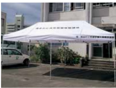
▲婦人会南淡支部から寄贈のテント ☎社会福祉協議会44-3007

同婦人会の寄贈については、地域活動のより良い充実を願うことです。 なお利用の申込み等は、南あわじ市社会福祉協議会へお問い合わせください。