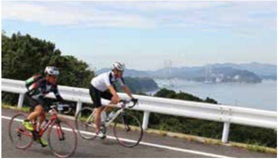
▲絶景を望みながら淡路島一周を楽しむ出場選手たち

淡路島ロングライド150kmを自転車一周する「2014淡路島ロングライド150km」が9月15日に開催され、1860人の参加者が秋の淡路島を走り抜けました。 参加者は淡路島国営明石海峡公園(淡路市)を日の出直後の午前5時45分から順次スタートし、朝日に照らされキラキラ光る大阪湾を眺めながらコースへと飛び出していききました。 またコース上の4か所のエ