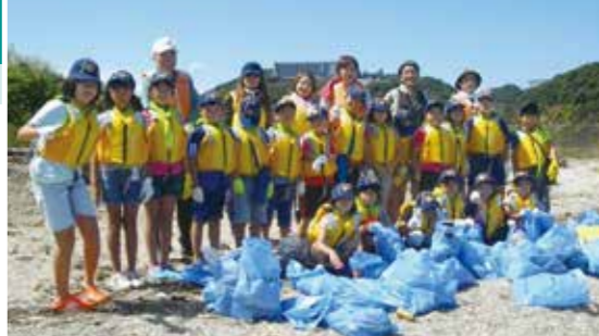
▲たくさんのゴミを集めたボーイスカウト隊員たち

南あわじ市でも9月13日にボーイスカウト隊員達約30人により、福良湾の洲崎海岸を清掃しました。