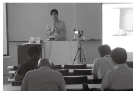
▲南あわじ志知キャンパスでのシンポジウムの様子

現在、「不登校・ひきこもり者支援」に関する同様のミニシンポジウムを、来年2月頃に開