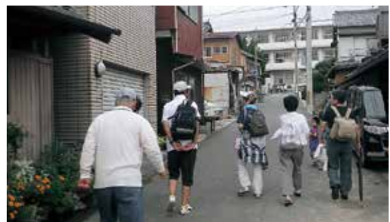
▲早朝に避難する福良地区の人たち