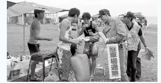
▲島外からの観光客らで賑わう海水浴場で行われた「飲酒運転の根絶」啓発活動

期間 9月21日(日)～30日(火)まで 運動の基本 『子どもと高齢者の交通事故防止』 重点項目 ①自転車の交通安全 ②飲酒運転の根絶 ③夕暮れ時の交通安全 ④全ての座席のシートベルトとチャイルドシート の正しい着用の徹底 ☎生活環境課 ☎43・5024