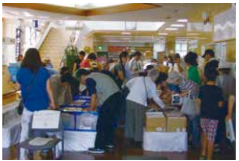
▲雑誌を選ぶ来館者たち

三原図書館で7月12日、13日の2日間、雑誌リサイクルフェアが開催されました。市内の各図書館(室)で購入した雑誌を、処分するのはなく、必要とする人に譲り、大切に使うって欲しいとの思いから実施されました。フェア中に約600人もの人々が来館し、並べられた2500冊から好きな雑誌を選んでいました。