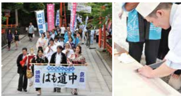
▲八坂神社を練り歩く一行(左)、鱧の骨切りショー(右)

身山田京都府知事に鱧を寄贈後、八坂神社から南座までの間を鱧を担いで往復し、八坂神社に戻ると鱧を奉納しました。奉納後には、境内で郷土料理の「ハモすき」約500食の振舞いが行われました。多くの人が淡路島の味覚を楽しもうと列をなしていました。食べた人は「おいしかった」と笑顔で話してくれました。