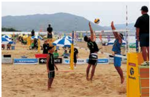
▲大会前にはビーチクリーン活動も行われ、美しく綺麗な砂浜のコートで開かれました

慶野松原で6月27日から29日の3日間、国内ビーチバレーの最高峰JVAビーチバレーボールシリーズA南あわじ大会が行われ、国内トップ選手らが迫力あるプレーを見せて熱戦を繰り広げました。白砂青松の慶野松原は、平成18年の国体競技会場にもなっている全国でも屈指のビーチバレーに適した海岸です。その素晴らしい景色をPRしようと地元パ