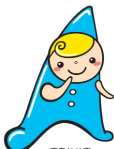
南あわじ市 子育て応援シンボルキャラクター