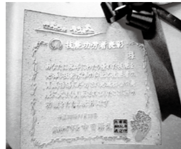
▲淡路いぶし瓦で作られた表彰盾が贈られました