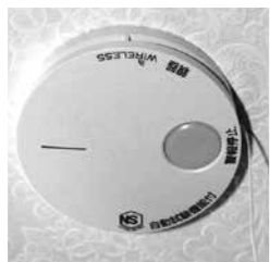
▲住宅用火災警報器