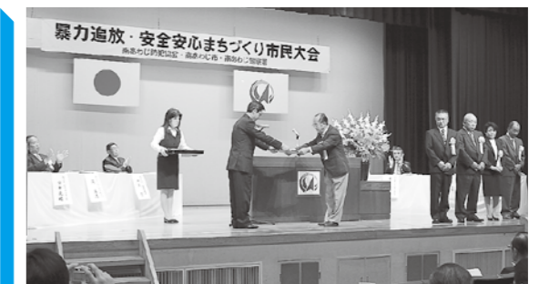
▲暴力追放・安全安心まちづくり市民大会(西淡公民館)