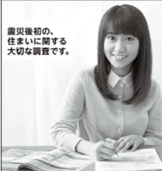
震災後初の、住まいに関する大切な調査です。