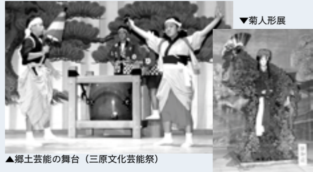
▲郷土芸能の舞台(三原文化芸能祭)