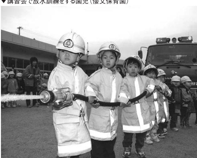
▼講習会で放水訓練をする園児(倭文保育園)