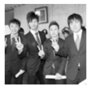
生涯学習文化振興課 ☎37・3020

日時 1月13日(日) 午後1時30分～ 場所 文化体育館 対象 平成4年4月2日～平成5年4月1日生まれの人 ※案内状の送付は行いません。市内に住民票を置いていない人も参加できます