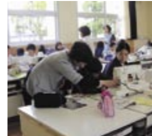
▲裁縫実習でミシンの補助を行う