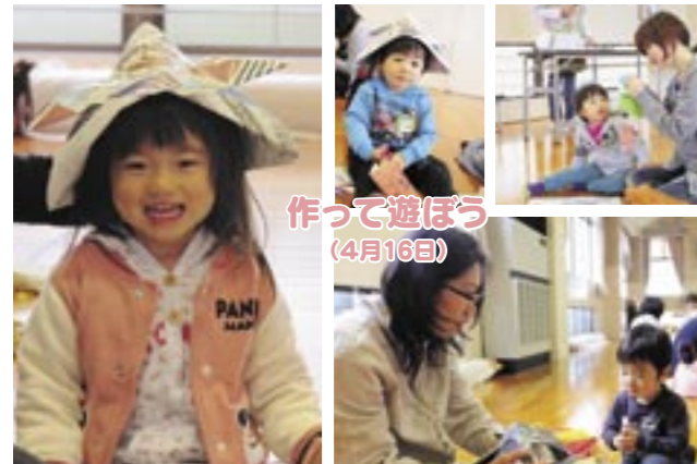
園子育て学習・支援センター ☎42-7703、9:00~16:00