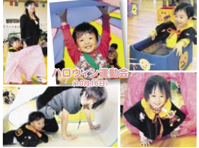
ハロウィン運動会(10月16日) 園子育て学習・支援センター☎42-7703、9:00~16:00