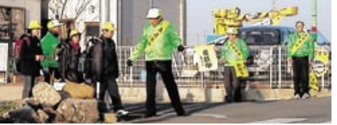
▲子どもたちの安全を見守る地域の人たち

◆青少年なんでも相談室(秘密は厳守) 日時 平日の13:00~16:00 場所 西淡公民館(青少年育成センター内) ☎青少年育成センター☎37-3026