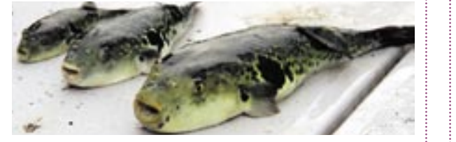
▲福良湾で養殖されたとらふぐ。左から1年物、2年物、3年物

冬の海の恵みである「とらふぐ」。てっちりやふぐ刺し、から揚げなど南あわじでは欠かせない食材の1つです。このたび5月に地域団体商標「淡路島〇〇とらふぐ」を取得しました。さて〇〇に入る文字は何でしょう？(ヒントは広報表紙)