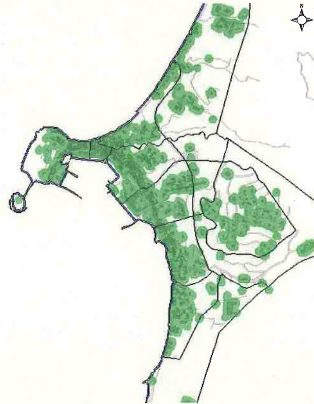
■：住宅密集地 建築物の立地状況から表示

南あわじ市の課題を明らかにし、防災まちづくりを進めるために行った調査のことです。 ある地域が南あわじ市全体の中でどのくらい危険性が高いか比較評価したものであり、地震災害の被害の規模を予測したものではありません。 災害危険度は、国のガイドラインに基づき、南あわじ市の地震災害に対する危険性の度合いを評価しています。