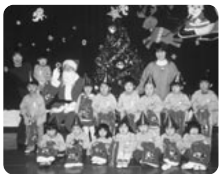
▲サンタさんといっしょに。（クリスマス会・倭文保育園）

おいしそうに食べていました。また、クリスマス会ではサンタさんの登場に目を輝かせていました。