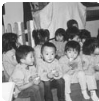
▲お味はいかが？（もちつき大会・広田保育園）

毎年恒例の年末行事、もちつき大会とクリスマス会が広田、倭文両保育園で行われました。もちつき大会では園児が自分たちでついた温かいもちを