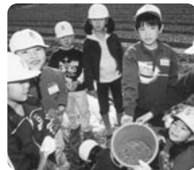
▲こんなに取れたよ。

十一月二十八日に広田小学校、十二月十一日には倭文小学校の二年生がそれぞれ、これまで育ててきた大豆を収穫。草取りや水やりなどをして大切に育ててきた児童らは丸々と実った大豆を一つ一つ丁寧にバケツに集めていました。