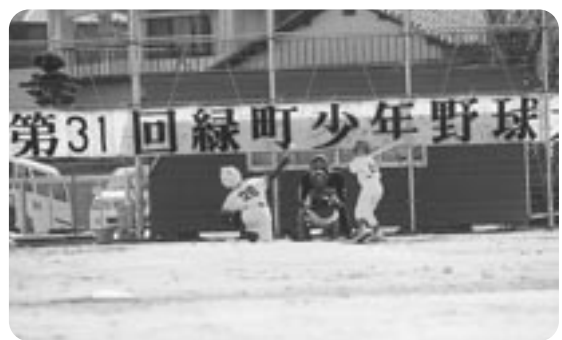
▲寒空の下、プレーする球児たち。