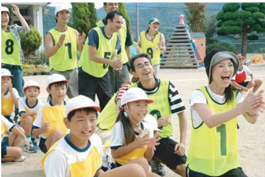
伊加利小学校 (田舎の運動会)