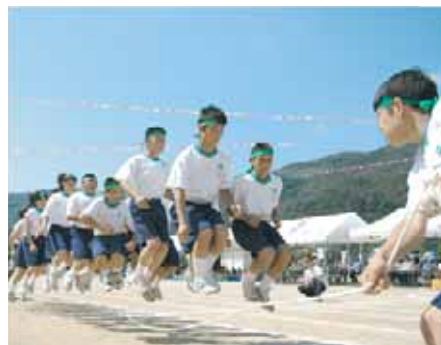
辰美中学校 (心ひとつにLet's Jump)