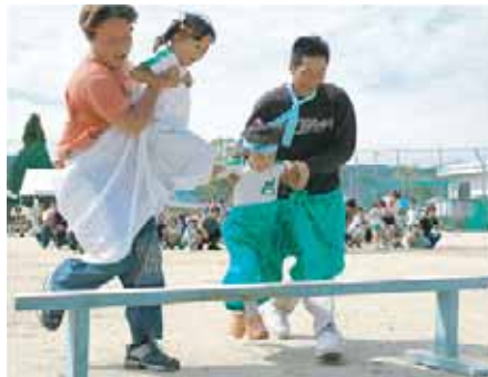
松帆保育園 (親子でパン!パン!!)