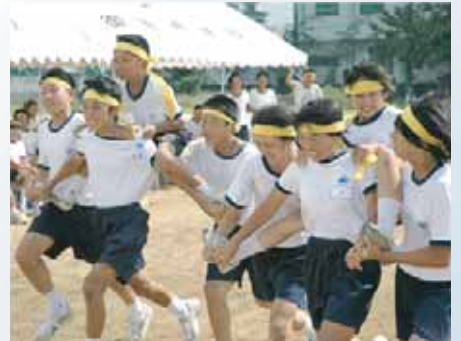
御原中学校 (騎馬戦! / レー)