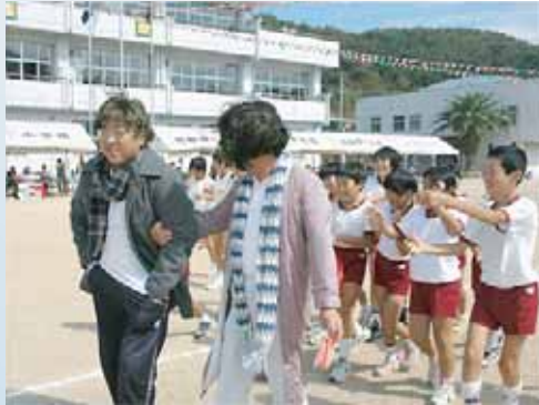
阿那賀小学校 (借り物のノノタ)