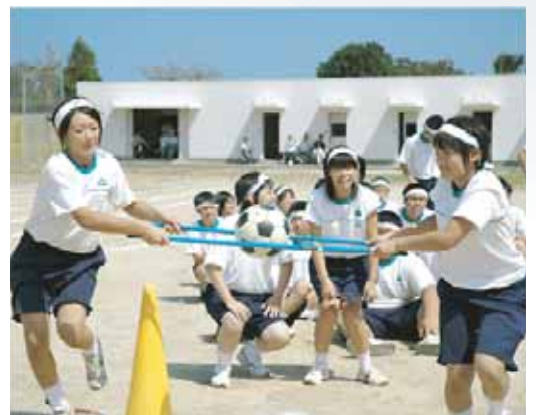
辰美中学校 (炎の3年五輪)