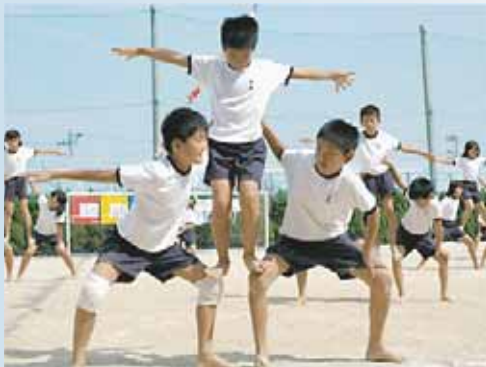
志知小学校 (組立体操)