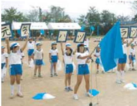
湊小学校 (応援合戦)