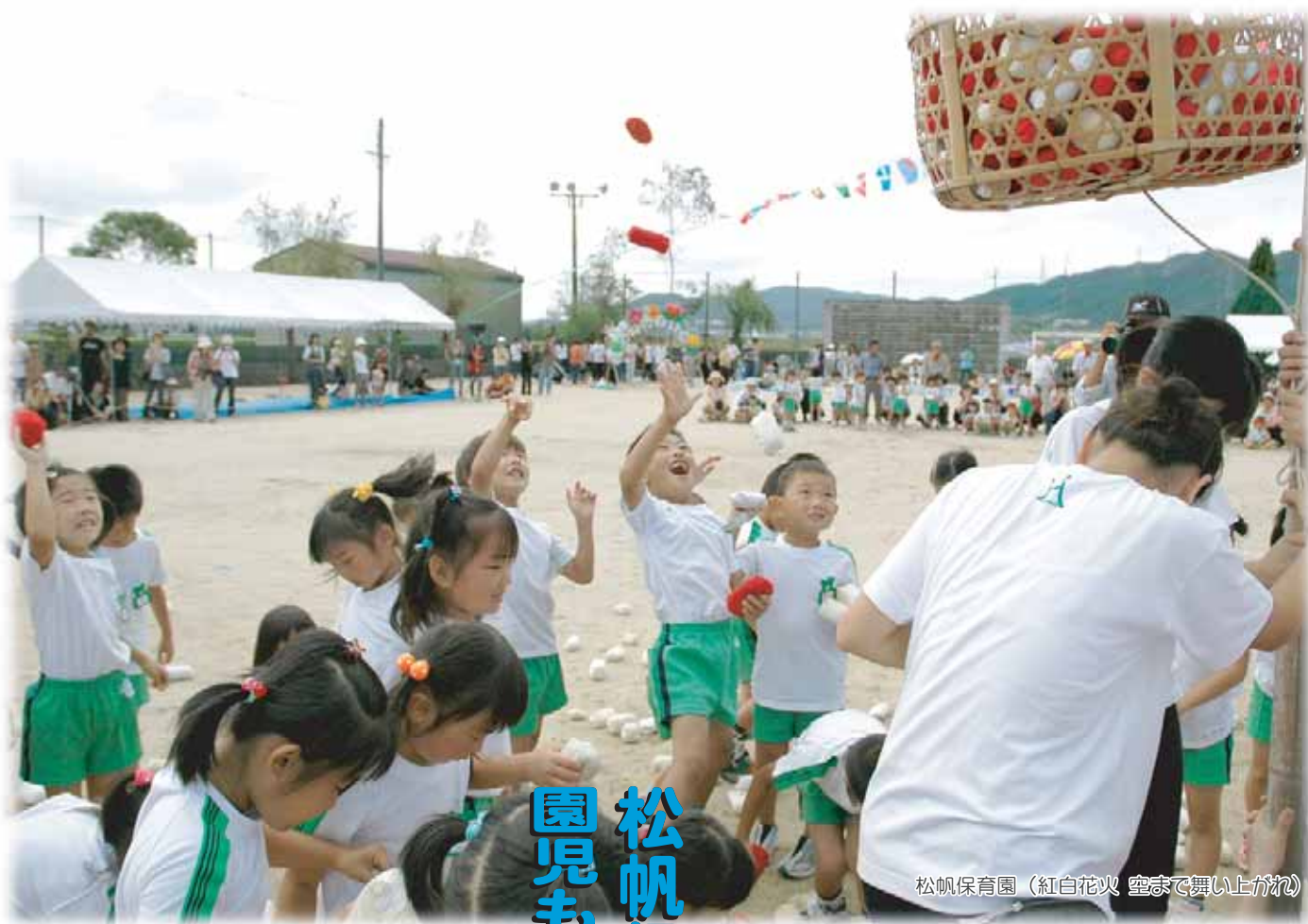
松帆保育園（紅白花火 空まで舞い上げろ）