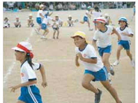
湊小学校 (うずしお)