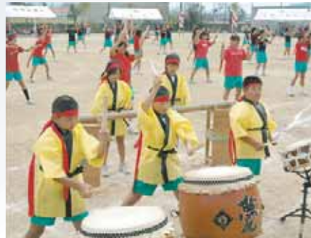
松帆小学校 (ヨッチヨレ! ヨッチヨレ! 松帆っ子)