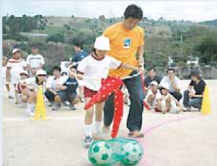
丸山小学校 (丸山ワールドカップ)