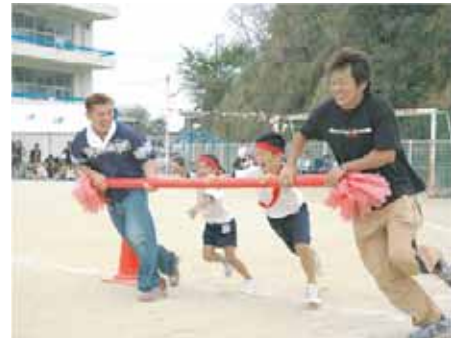
津井小学校 (津井っ子タイフーン)