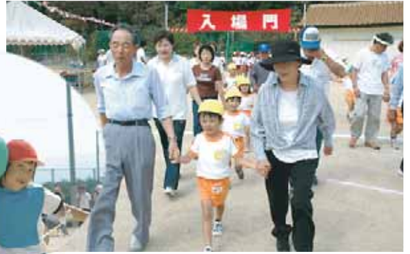
丸山小学校 (いつまでもな・か・よ・く!)