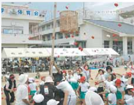
松帆小学校 (紅白玉入れ)