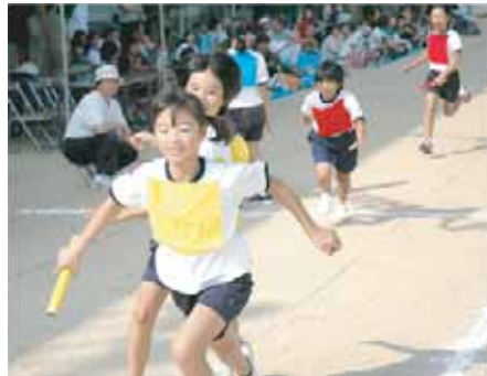
志知小学校 (ゴールを目指せ!)