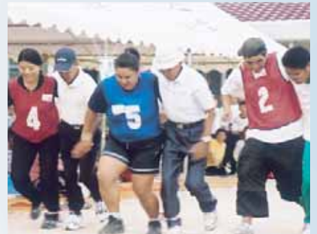
伊加利小学校 (田舎の運動会)