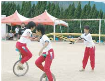
津井小学校 (我こそベストフォーマー)