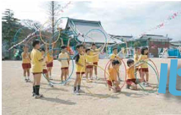
阿那賀小学校 (はばタンカーニバル)