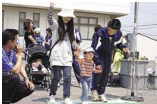
交通安全教室(三原健康広場)

◎お申し込み先=①・②・⑥・⑧せいだん、③みどり、④みはら、⑤みどり、⑦各センター