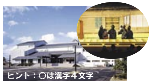
ヒント：〇は漢字4文字

淡路人形座では、4月から新人2人がデビューし、プロとしての道を歩み始めました。さて、この淡路人形座は淡路人形浄瑠璃館で上演していますが、この上演施設のある建物(写真)の名前は？(うずの丘〇〇〇〇記念館)