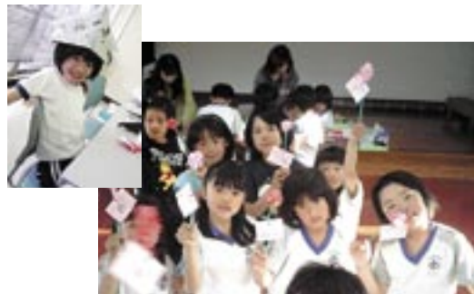
左上||折り紙の工作 右下||母の日の花を作製

放課後子ども教室の物づくりは、子どもの大好きな体験活動です。苦心したことや出来上がった喜びから達成感をえて、作品や話題を持ち帰り「凄いいね」「上手にできたね」「かわいいね」など、褒めてもらうことは、子どもにとって何より「心の栄養」です。