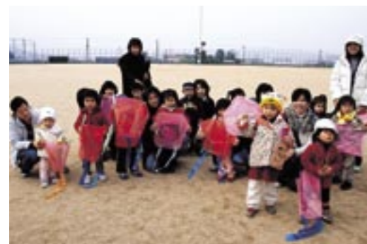
▲お正月遊び (1月11日、三原健康広場)

みどり ☎44-3008 開設日：月・火・水・金 せいだん ☎37-3028 開設日：月・火・木・金 みはら ☎42-7703 開設日：火・水・木・金 なんだん ☎50-3048 開設日：月・火・