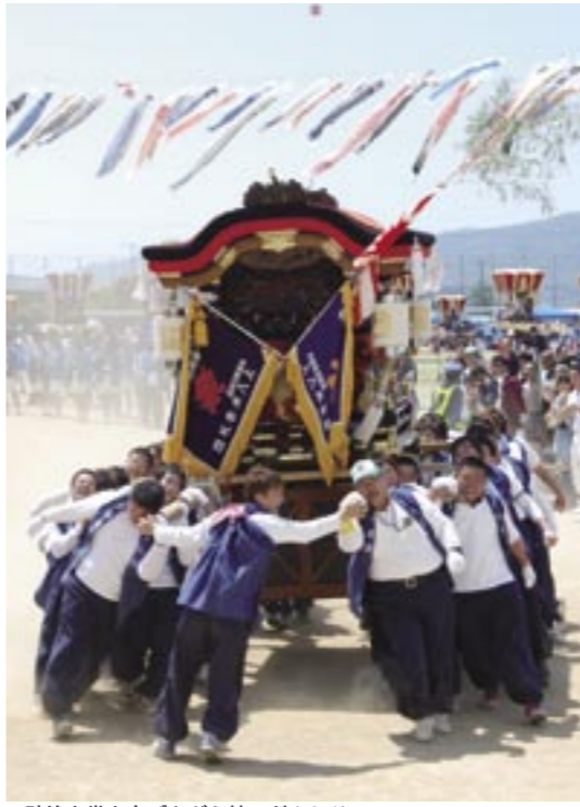
▲砂埃を巻き上げながら練るだんじり

ナー、南あわじ市と交友関係のある東かがわ市と鳴門市の物産店などが設置され、早くからたくさんの方の来場者で賑わいました。グラウンドでは、砂埃を巻き上げながら勢い良くだんじりが一斉に練る「総練り」や