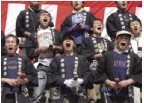
▲節回しを合わせてだんじり唄を熱唱