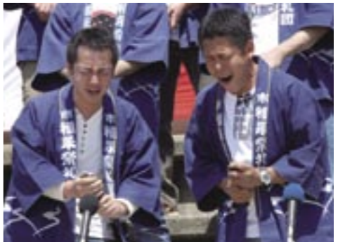
▲配役を熱演する祭礼団員

投げだんじりの披露が行われました。また多く露店が並び駐車場でも獅子舞が披露され、見るものを圧倒させました。舞台では、各集落の若者らで構成する祭礼団により伝統