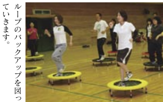
▲トランポ・ロビックスを楽しむ若者グループ

とは、直径八十六センチのミニトランポリンの上で、エアロビクス・エクササイズをするというもの。参加者は一時間、さわやかな汗を流し、シェイプアップを図りました。同グループでは今後、今年度成人式実行委員会との引継ぎを兼ねた交流会や若者情報誌の発行、若者会議などを予定しています。