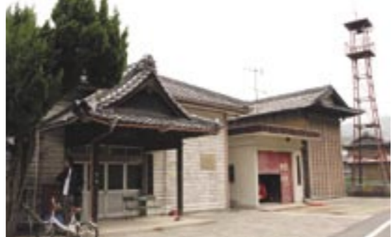
▲阿万上町公会堂と消防団屯所、だんじり小屋、半鐘台(左から)

阿万上町の公会堂と消防団屯所、だんじり小屋、半鐘台が、三月三十日、県の景観形成重要建造物等に指定されました。「景観形成重要建造物等」とは、地域の景観の形成に重要な役割を果たしている建造物や工作物、樹木のこと。兵庫県では、優れた景観の保全を目的に、平成十七年度からこの指定を始め、十八年度は十件を決定し、その内一件に阿万上町公会堂他が選ばれま