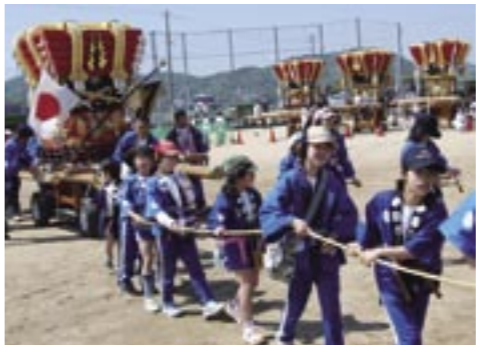
▲子どもだんじりも参加。唄も披露しました