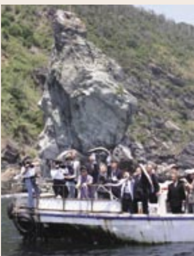
▲上立神岩の前で鱧を放流

鱧は、これからどんどん脂が乗っておいしくなります。鱧料理の元祖といえ、灘・沼島です。ぜひ、食へに来てください。丸々太った鱧を用意して、心よりお待ちしております。