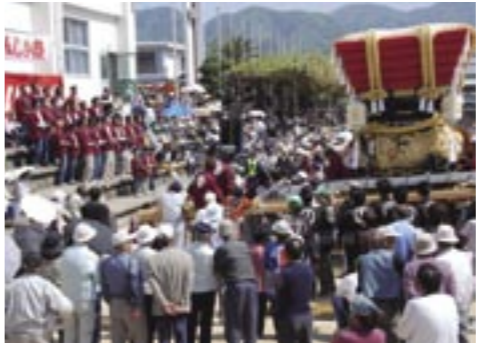
▲だんじり唄に聞き入る来場者