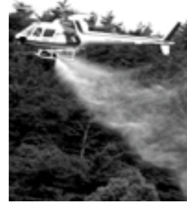
▲ヘリコプターによる航空防除

松くい虫航空防除で使用するスミパイン乳剤は、現在使用されている殺虫剤の中では人畜に対する毒性が最も少ない薬です。散布も安全な方法で行いますが、一層の安全を図るため、次のことに注意してください。