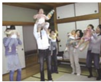
▲音楽に合わせて親子でダンス(せいだん)