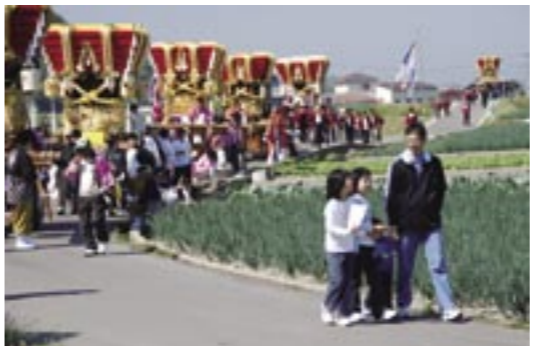
▲玉ねぎ畑の道を通り、だんじりが連なって会場へ