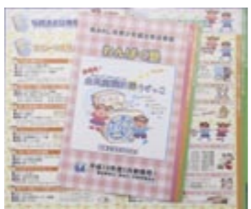
▲わんぱく塾募集パンフレット

南あわじ市教育委員会は5月、全児童3千人に「全児童選択機 うずっこ」と題した「わんぱく塾」の募集パンフレットを配布しました。 昨年度まで旧町から継続開催していた「あそび塾」と「100円塾」、「うずしお交遊塾」を統合。今年度から「わんぱく塾」として一つにまとめ、それぞれが持っていた良さを生かしながら各プログラムを再構成しました。