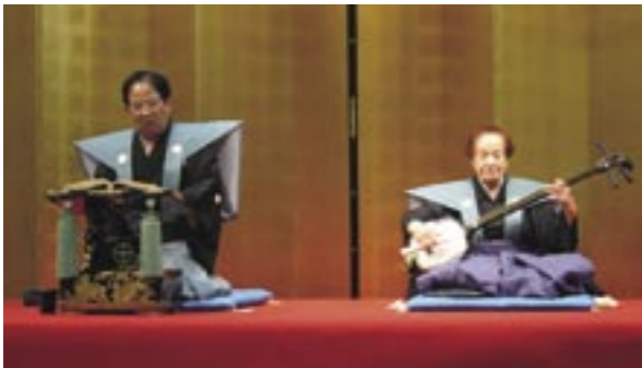
▲人間国宝・鶴澤友路師匠(右)の三味線に合わせて熱唱する義太夫

この大会は、浄瑠璃の普及と愛好者の技術向上を目指して、昭和二十六年から続く伝統ある大会で、これまで多くの方が自慢ののどを披露されています。