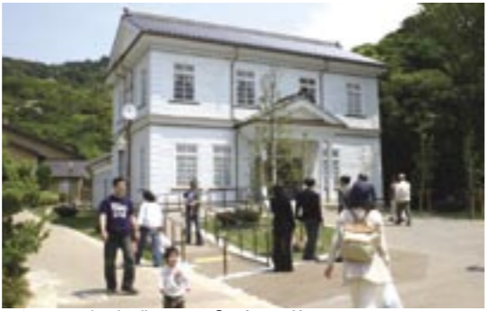
▲旧三原郡役所を復元した「国生みの館」

文化遺産が、蘇りました。震災で被災し、解体・保存していた旧三原郡役所を復元した、「国生みの館」が完成。四月二十八日、その竣工式が淡路ファームパークイングラ