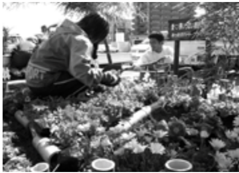
▲あわじ緑化推進交流会花壇コンテスト