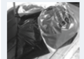
▲他の袋に入れ、指定袋を添付