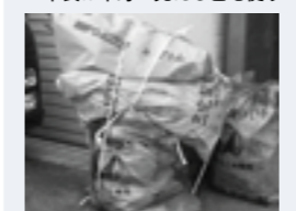
▲袋に入る量にする