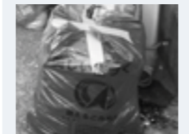
▲ガムテープで口を止めない。中袋は中身が見える色を使う