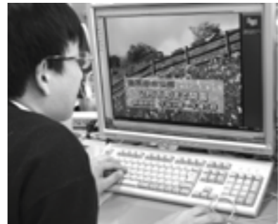
▲光ブロードバンドなら動画も高速でダウンロード

加入申込みをされ、平成20年3月末までに宅内工事を済ませられた場合、通常73500円の加入料（加入分損金と引込工事費）が21000円になります。（ただし、宅内工事費は実費負担） まだ加入申込みをされていない方は、ぜひこの期間内にお申込みください。 申し込み先は、市役所情報課（☎43・5003）、各総合窓口センター、支所、出張所、連絡所へ。