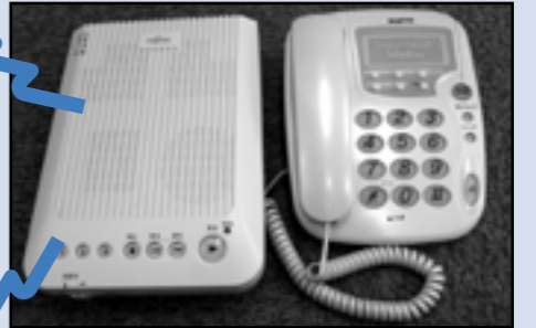
▲音声告知端末（左）とケーブル電話機