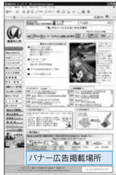
バナー広告掲載場所

南あわじ市では、「広報南あわじ」と「南あわじ市ホームページ」で広告を掲載します。 広告が掲載できるのは、市民の福祉、市民生活の利便性などを考慮したもので、公の秩序または善良な風 俗に反するものや意見広告、人権侵害や差別を助長するおそれのあるものなどは掲載できません。 詳しくは情報課（☎43・5003）または、市ホームページをご覧ください。