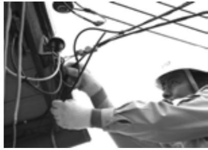
▲引込工事(保安器の取り付け)