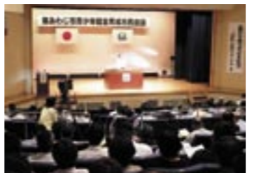
▲昨年の市民会議の様子。毎年7月に開かれ、多くの人たちが参加しています

子どもたちは、限らない可能性を秘めた、私たちのまちの大切な「跡継ぎ」です。その子どもを取り巻く環境は、今危ないといわれています。